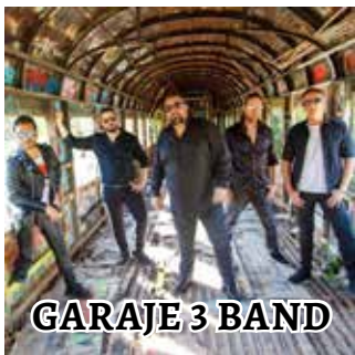
GARAJE 3 BAND